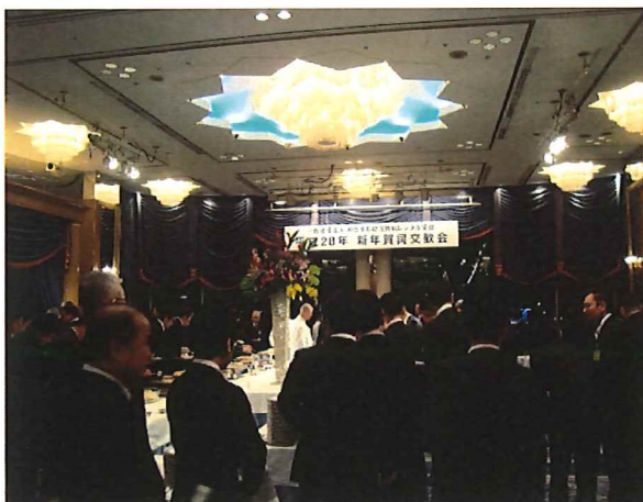
<ペリー来航の間 懇親会>